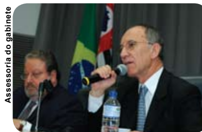
Assessoria do gabinete

Presente ao ato em defesa do Hospital do Campo Limpo (ago/07)