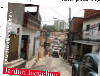
Assessoria do gabinete