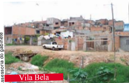
Assessoria do gabinete

Veja algumas das áreas que o mandato vem acompanhando: