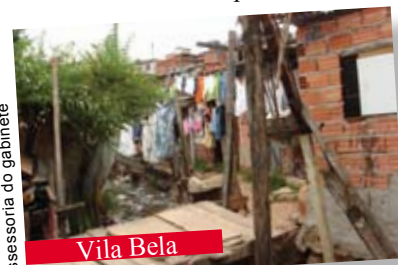
Assessoria do gabinete

sas reuniões com a Coordenação de Regularização Fundiária do Município, Defensoria Pública, bem como solicitaram consulta à Diretoria Nacional de Assuntos Fundiários Urbanos, com objetivo de sensibilizar o agente público para dar continuidade na regularização fundiária do Jardim Jaqueline.